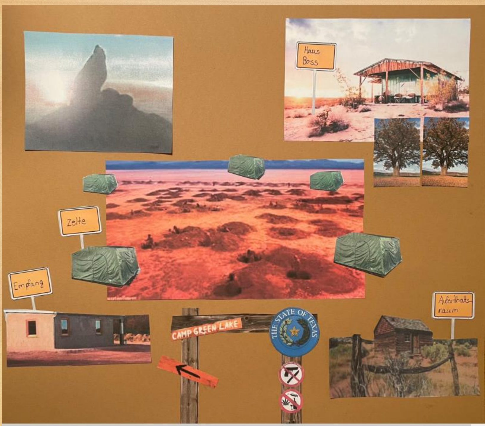
Karte von Constantin K.