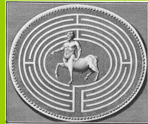
Das Labyrinth des Minotaurus